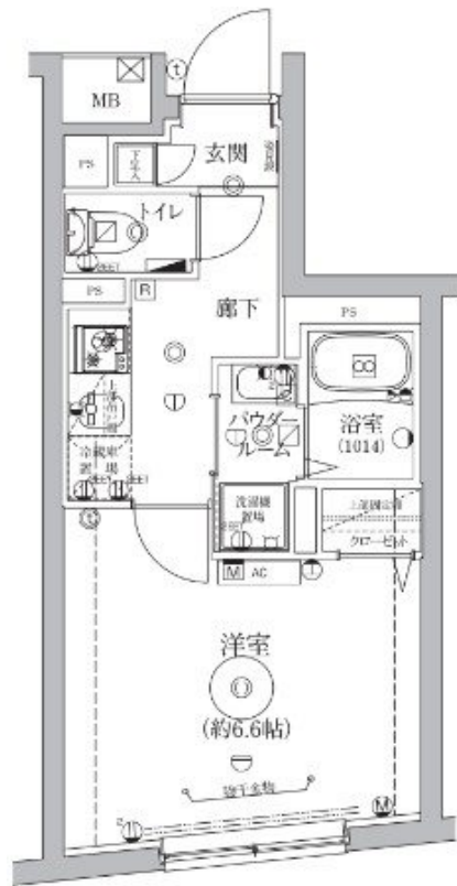
図面と現状が異なる場合は現状優先となります。