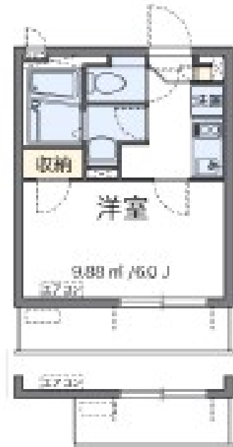
※ 各階3号室バルコニー