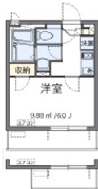
※ 各階3号室バルコニー