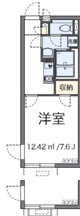
※2・3階6号室 フラワーボックス