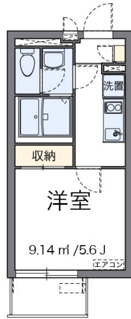
※各階2号室 同タイプ